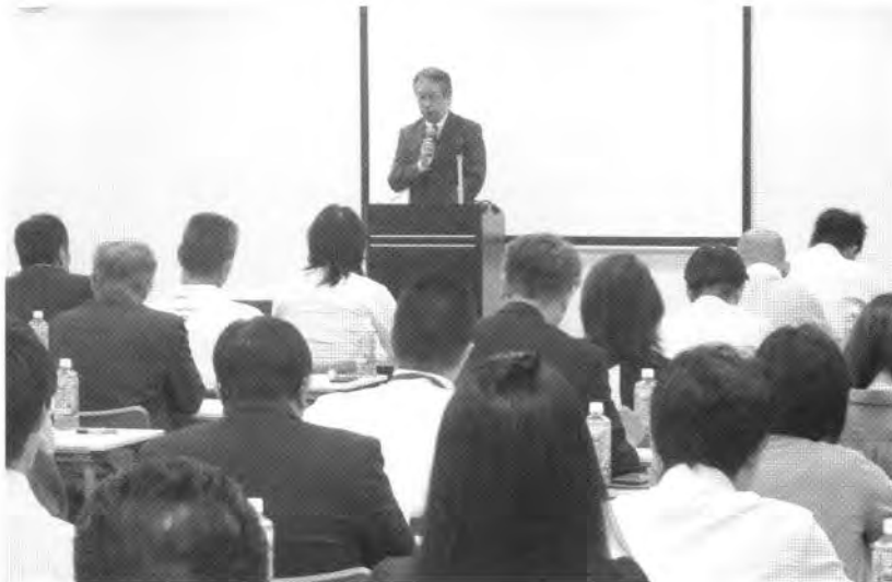
講習会風景（愛知県産業労働センターにて）