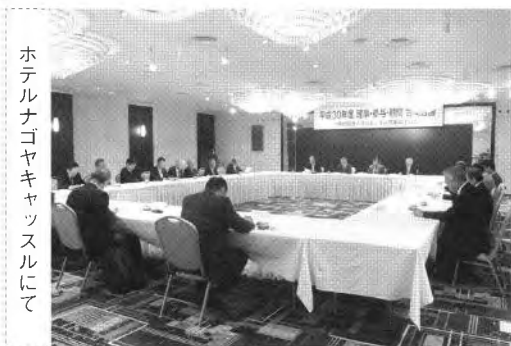
ホテルナゴヤキャッスルにて

議事の、①役員について②平成30年度上半期事業概況報告③下半期事業計画④その他―は、すべて承認されました。