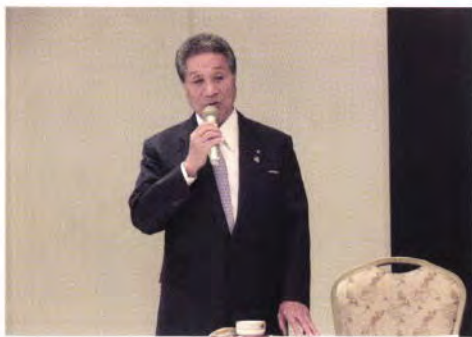
当協会合同会議（ホテルナゴヤキャプセル）にて

稲沢市正明寺の名古屋文理 大学文化フォーラムで、市制 60周年記念式典を開催しま した。