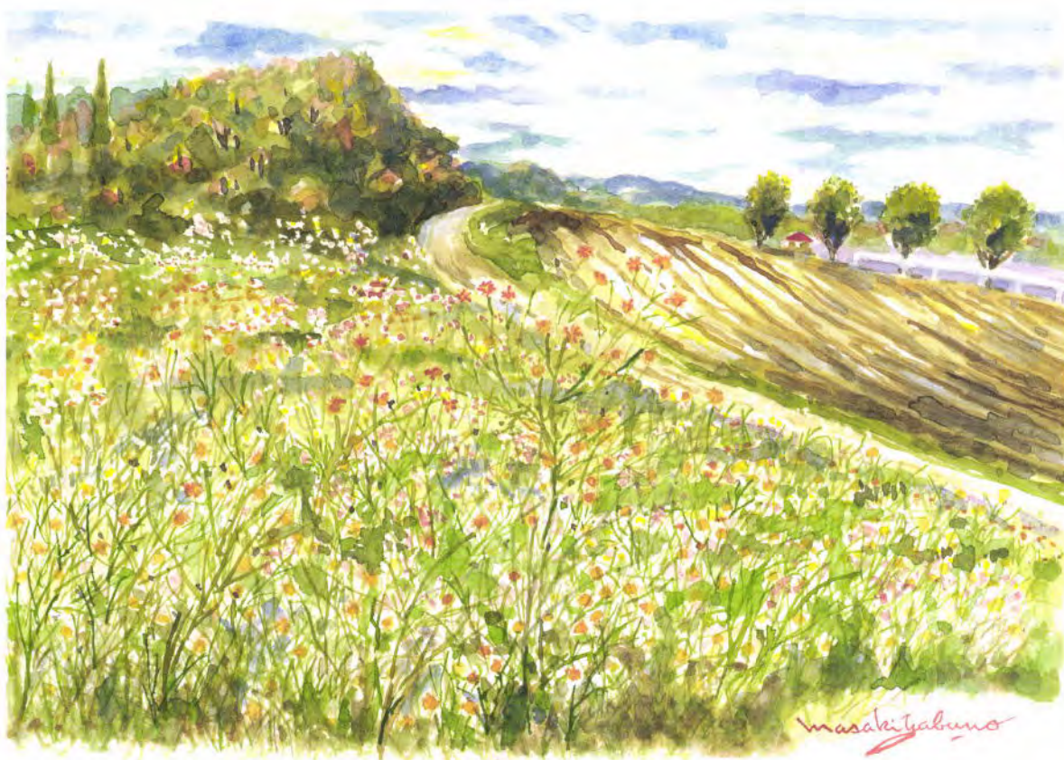
絵・藪野正樹(二紀会会員)「コスモス畑がある坂道」